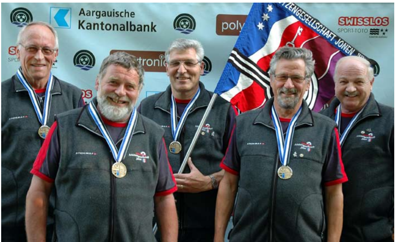
Die Gruppe der SG Jonen erreichte den dritten Platz im Feld D