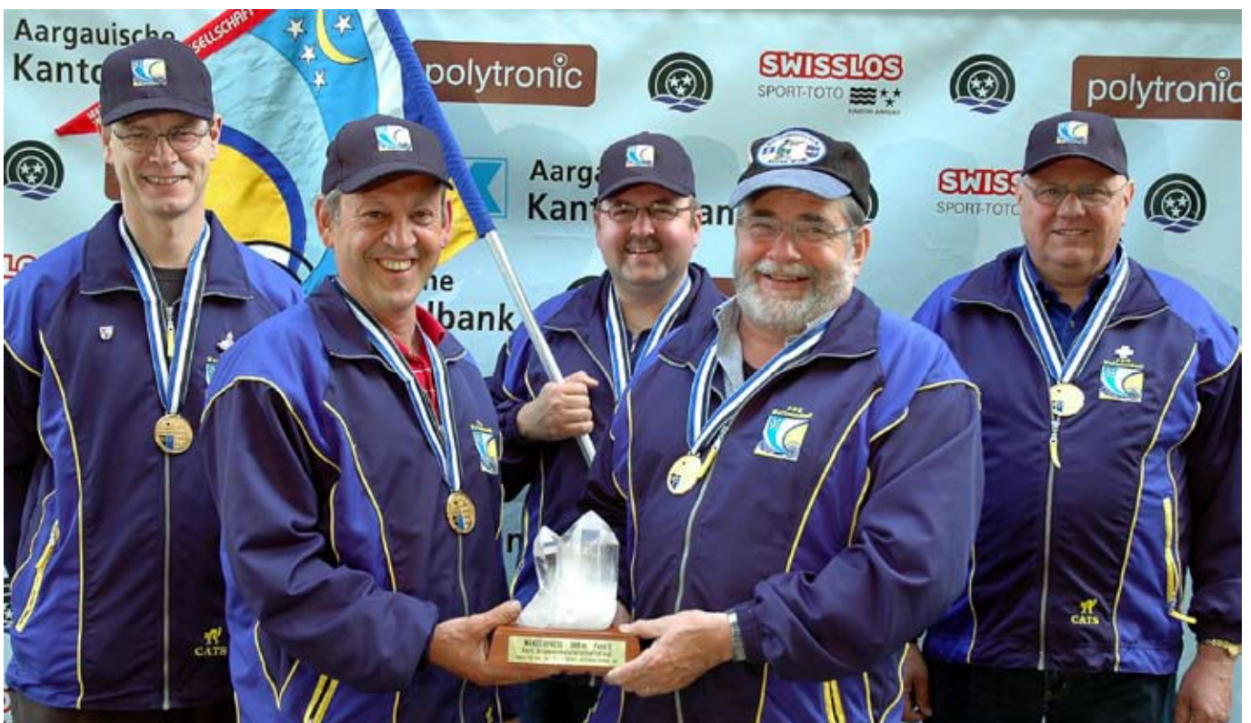
Die FSG Waltenschwil ging als Sieger im Feld D hervor