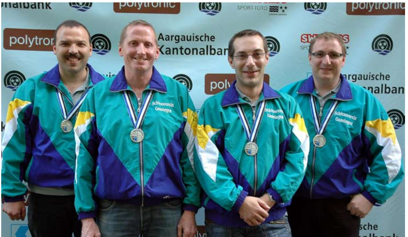
Gansingen aus dem Fricktal durfte die Silbermedaillen im Feld D in Empfang nehmen

allem auch um die 1. Hauptrunde. Die FSG Waltenschwil beteiligten sich mit nicht weniger als vier (!) Gruppen am Final. Drei davon dürfen in der Hauptrunde weitermachen. Die Krone auf die Erfolgserie setzte Waltenschwil 4 auf, welche den Kantonal-Final gewann. Den zweiten Platz belegte der SV Gansingen vor der SG Jonen. Alle drei Gruppensieger durften den begehrten Wanderpreis der Politronic AG in Empfang nehmen.