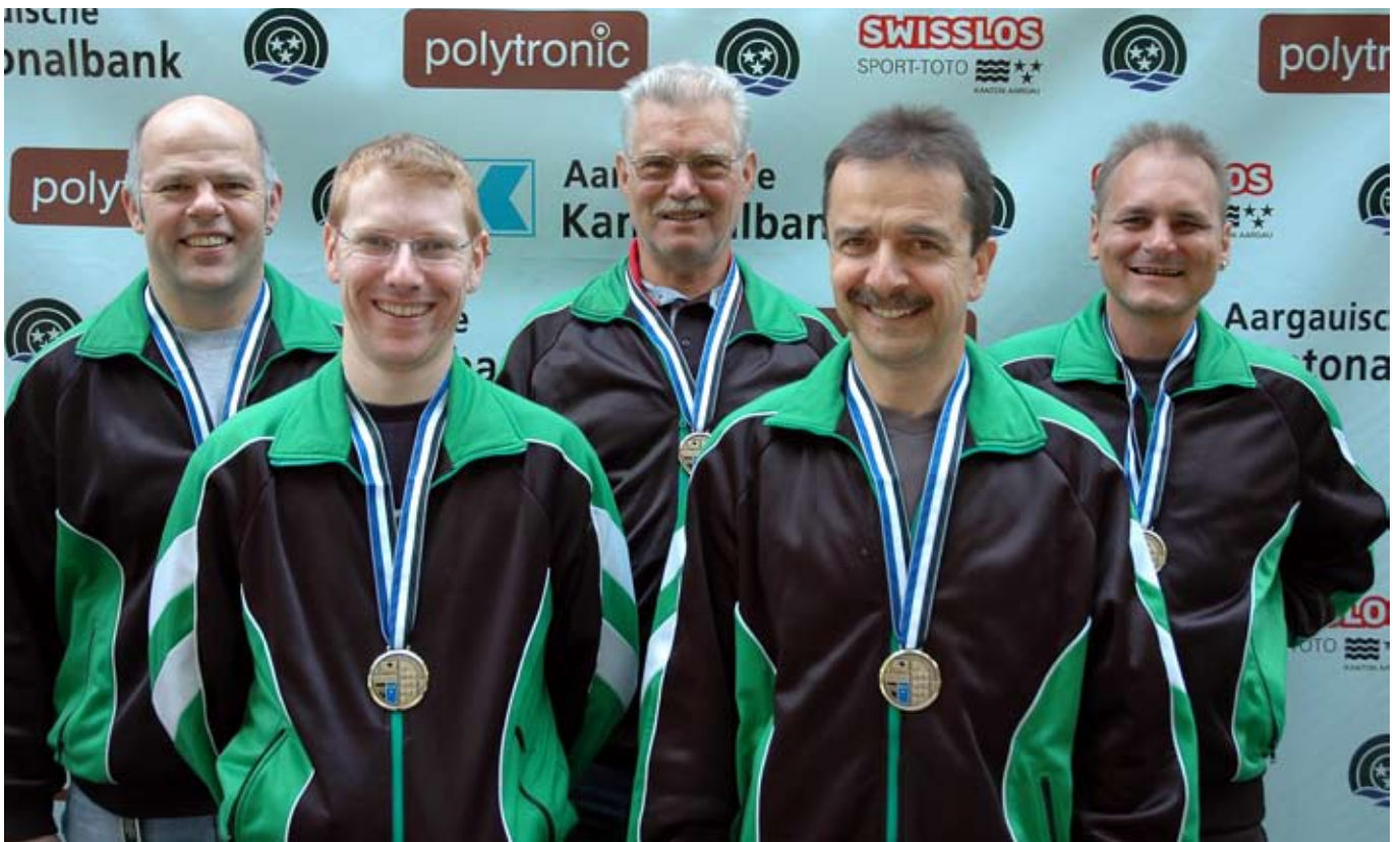
Die Schützen des MSV Kölliken mit den Bronzemedailles im Feld B

Gruppen qualifizierten sich im Feld B (Stgw 57) für den Kantonal-Final. Bei diesem Rangverlesen durften drei ganz andere Gruppen als vor einem Jahr die begehrten Medaillen in Empfang nehmen. Es siegte die SG Safenwil vor der SG Neuenhof. Die Bronzemedaille konnten die Schützen vom MSV Kölliken im Empfang nehmen. Im Feld D durfte mit Armeewaffen der Wettkampf absolviert werden. Insgesamt 93 Gruppen kämpften um die vordersten Plätze, und vor