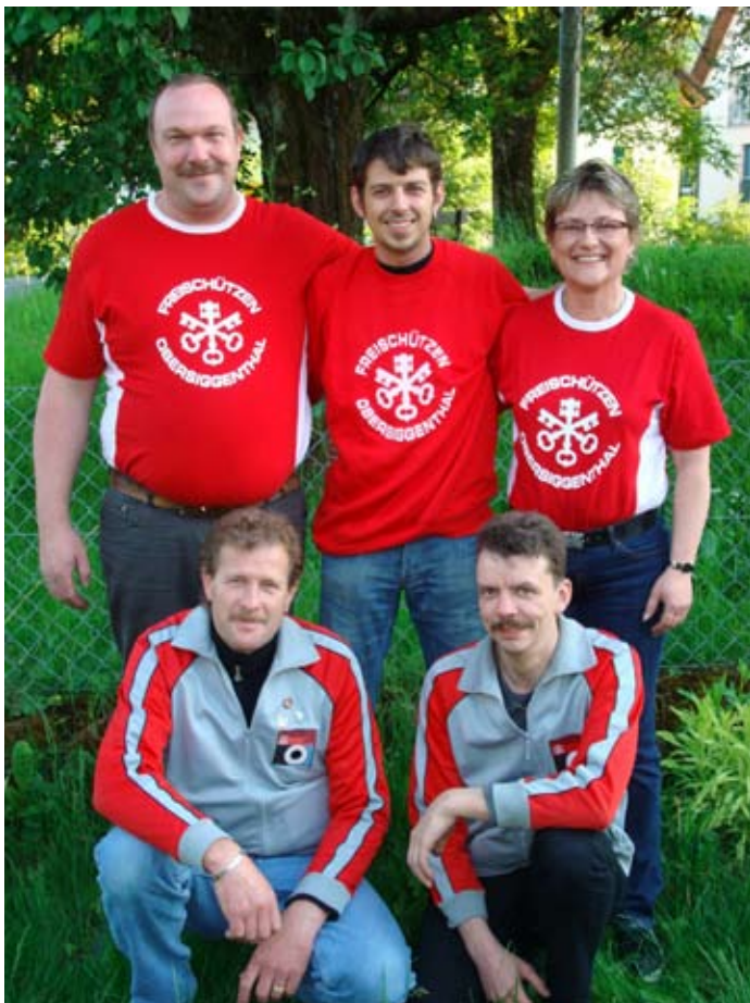
FS Obersiggenthal waren überrascht von der Podestplatzierung im Feld A