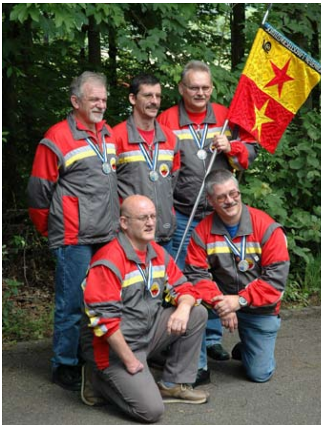
SG Neuenhof errichte im Feld B den zweiten Rang